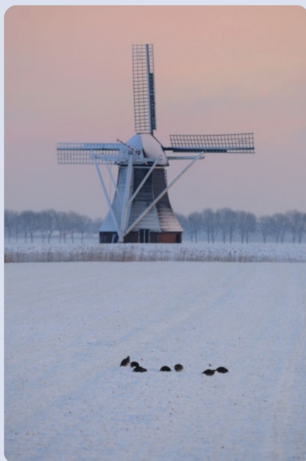
Patrijzen in de sneeuw.

Bij deze nodig ik jullie uit vele waarnemingen in te sturen en als het kan met terugwerkende kracht ook je oude waarnemingen.