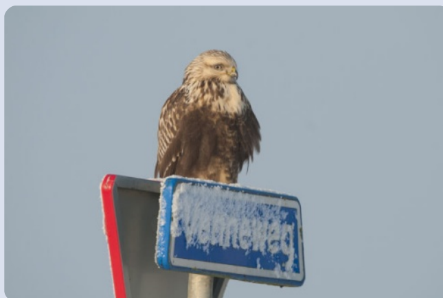
Ruigpootbuizerd Hans Hut ©

Kies bij het aanmaken van je eigen account het profiel "Werkgroep Grauwe Kiekendief", dan worden jouw waarnemingen apart op onze eigen site getoond. Wij zijn er van overtuigd dat we zo met z'n allen het landelijke beeld van akkervogels scherp kunnen stellen. Maar...natuurlijk is het ook erg leuk de sijsjes in je tuin, de dodaars in een winterse stadsgracht of een voorbijvliegende Sperwer door te geven.