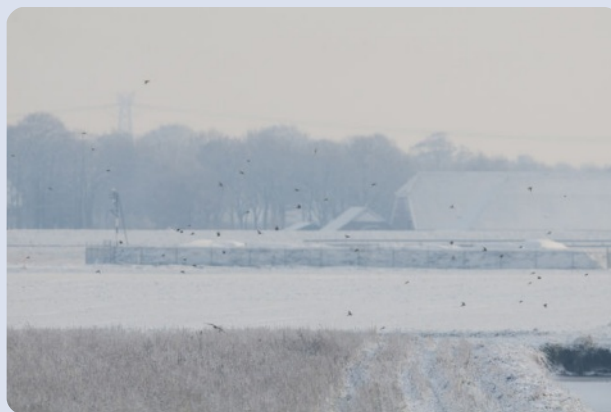
Jagende Blauwe kiekendief boven een wintervoedselveldje.

Zoals eerder aangegeven is de Werkgroep in gesprek met waarneming.nl . Deze slimme ICT-ers zullen voor ons een webapplicatie maken waar we onze punttelgegevens (broedvogelwerk) op een soepele manier kunnen invoeren. Een aantal punttellers zullen we om feedback vragen. In de loop van 2011 praten we jullie uitvoerig bij over de aard van onze samenwerking met waarneming.nl . Jullie mogen er vanuit gaan dat vóór het komende broedseizoen een goed invoerscherm klaar is.