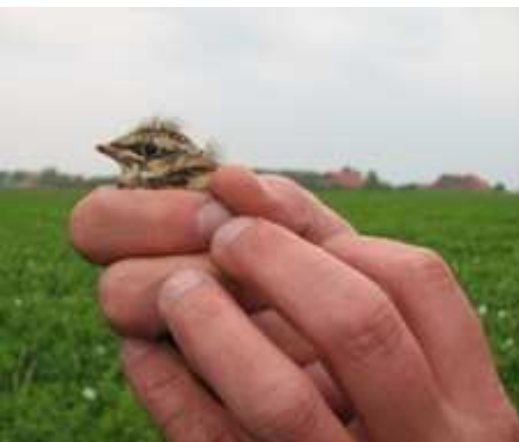
Veldleeuwerik van 8 dagen oud, nabij Nieuw Beerta, nest in Luzerne.