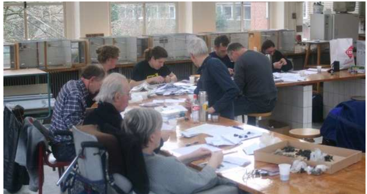
We konden rekenen op flink wat hulp tijdens het pluizen van de braakballen en plukresten. Zelfs met mooi weer

Op 14 maart en 18 april heeft een flinke groep mensen geholpen met het doorwerken van een flinke stapel braakballen. Leek de stapel uit 2008 en nog een deel uit 2007 eerst veel te groot om door te komen, plots bleek het met zoveel volk als een speer te gaan. Zeker met koffie en koeken erbij bleek het goed te doen. We konden rekenen op hulp van mensen uit alle windstreken, dank hiervoor!